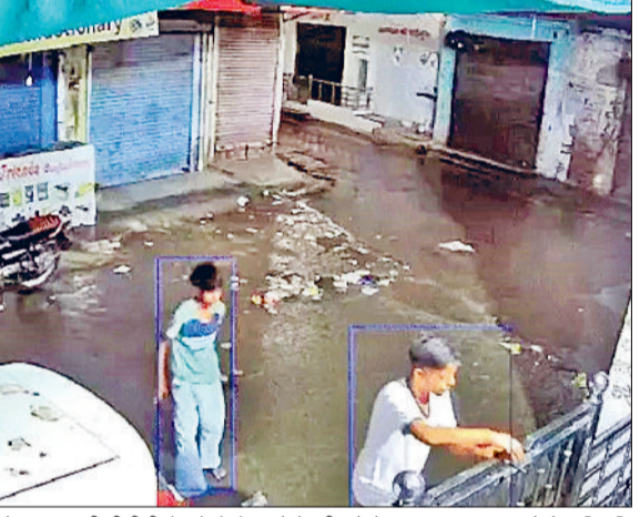
फतेहाबाद। सीसीटीवी कैमरे में कैद चोरों की फोटो।