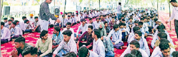
सिरसा। रोजगार मेले में भाग लेने पहुंचे युवा।