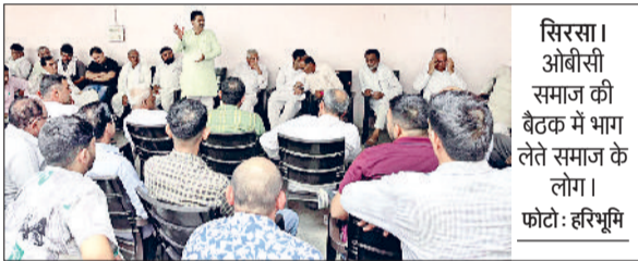
सिरसा। ओबीसी समाज की बैठक में भाग लेते समाज के लोग।

एचएयू विश्वविद्यालय के कुलपति के खिलाफ जातिगत रणनीति को अंजाम दिए जाने के मामले में ओबीसी समाज की एक अहम मीटिंग कंबोज धर्मशाला में हुई, जिसमें ओबीसी समाज के विभिन्न वर्गों के पदाधिकारियों ने भाग लिया और इस पत्रकारिता को तूल देने की कड़े शब्दों में निंदा की। ओबीसी समाज के पदाधिकारियों ने कहा कि कुलपति द्वारा विद्यार्थियों की सभी मांगों को मान लिया गया था, लेकिन बावजूद इसके कुछ राजनीतिक दल के लोगों द्वारा अपनी राजनीतिक रोटियां सेकने के लिए मामले को तूल देने का काम किया जा रहा है, जोकि उचित नहीं है।