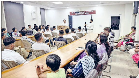
फतेहाबाद। एमएम कॉलेज में सम्मेलन को संबोधित करते मुख्य वक्ता।