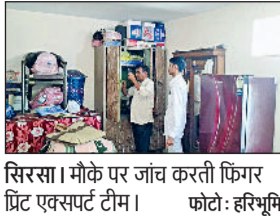
सिरसा। मौके पर जांच करती फिंगर प्रिंट एक्सपर्ट टीम।